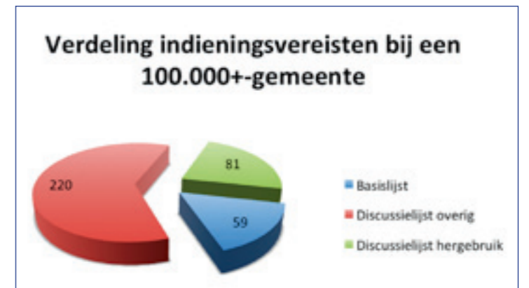
Figuur 1: Verdeling indieningsvereisten in categorieën bij een 100.000+-gemeente

Figuur 1 bevat een geanoniseerd voorbeeld van een 100.000+-gemeente.